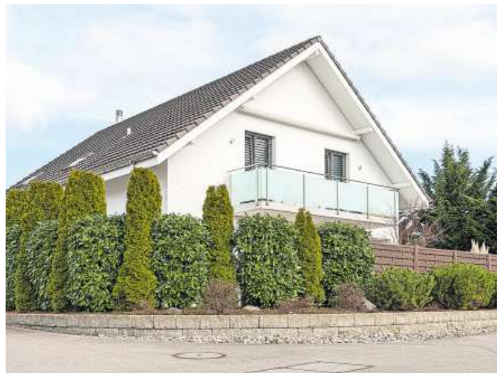
Bleibt teuer: Einfamilienhaus im Aargau.

Günstig zu erwerbendes Eigentum ist noch rarer geworden. Nur noch in sechs Prozent der Gemeinden liegen die mittleren Marktwerte von Eigentumswohnungen unter 700 000 Franken. Das entspricht etwa einem Dutzend Gemeinden. Im Vorjahr waren es noch doppelt so viele. Dafür stiessen mehr Gemeinden ins Hochpreissegment vor. Für eine Eigentumswohnung blättert man im Aargau durchschnittlich 900 000 Franken